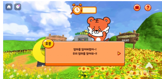
'트래블 헌터-K' 테마월드 중 아기 호랑이 호종이의 잃어버린 엄마를 찾는 '런 타이거 마운틴'.

또한, 11월 25일에는 3차로, 한국관광공사의 메타버스 홍보 및 유저모임 및 교류 활동 공간인 '플레이 코리아(Play Korea Club)'이 공개된다.