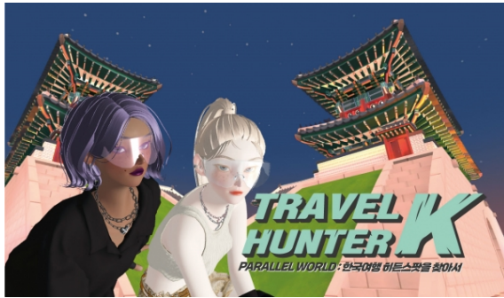
문화체육관광부와 한국관광공사가 아시아 최대 메타버스 플랫폼인 '제페토'에 출시한 한국관광 테마월드 시리즈 '트래블 헌터-K'.